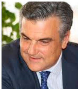
JESÚS SILVA FERNÁNDEZ (Sevilla, España, 1962)

Diplomático español, actual embajador de España en Venezuela. Ha sido consejero técnico en la Jefatura de Protocolo de Presidencia del Gobierno, cónsul general de España en Rosario y consejero cultural en la Embajada de España en Bonn y en Berlín (Alemania).