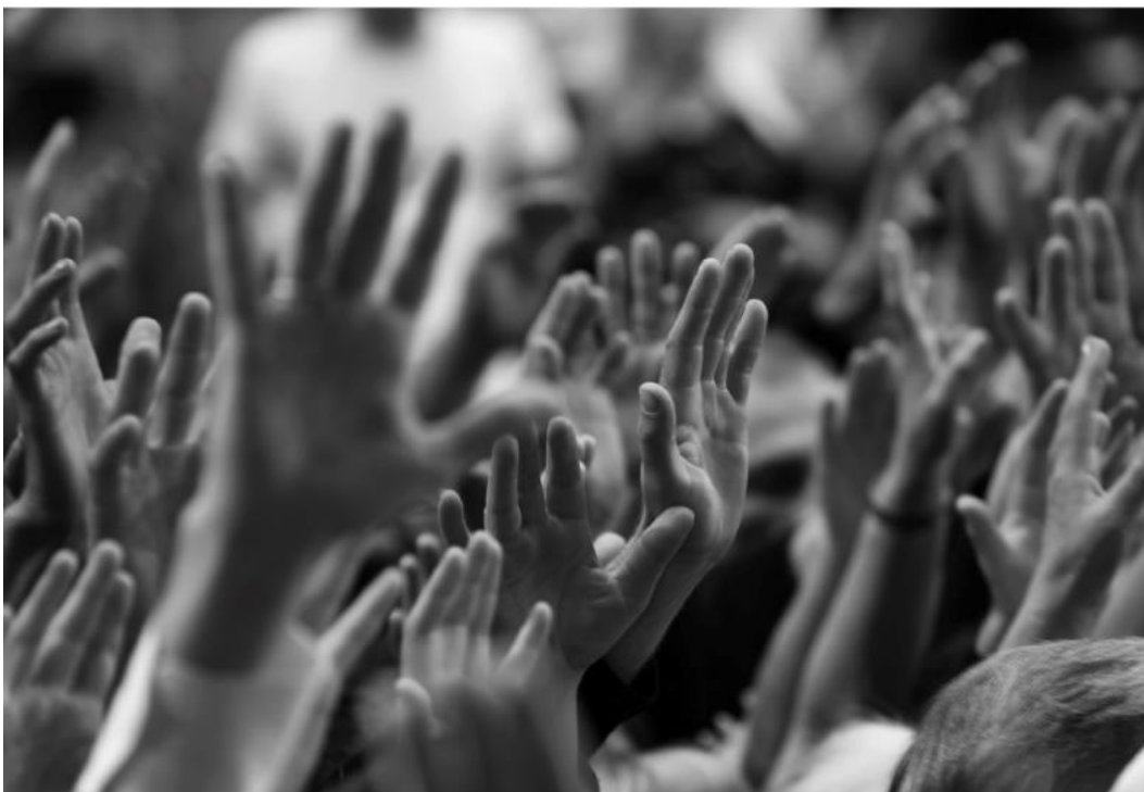
Democracy Index 2018

A report by The Economist Intelligence Unit